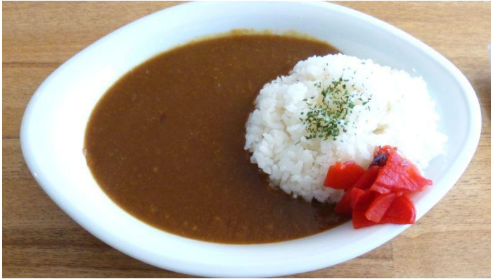
【具がない海老カレー】