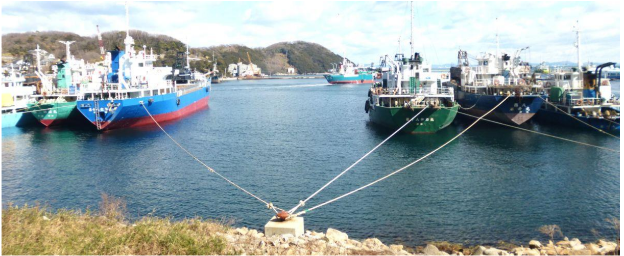
【家島の貨物船係留風景】

島の北東の端の高台に「家島神社」があり、100段以上の階段を登ると本殿がある。誰もおらず、ひっそりと静まりかえっている。