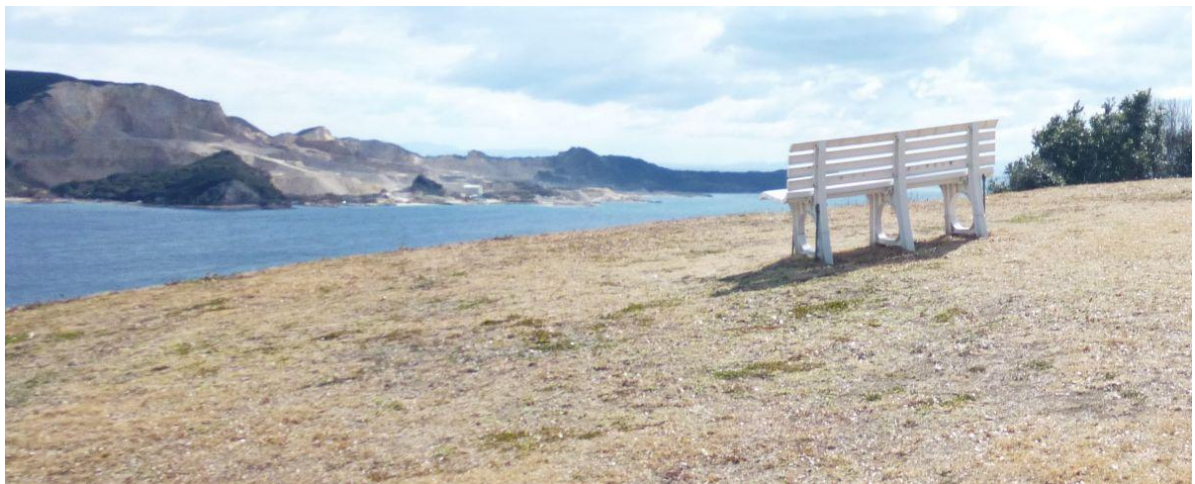
【清水公園から西島を見る】

西島は家島諸島4島で最も大きい島だが、島民は4人しか住んでいない。ただそれは2020年の調査だから現在はどうなっているのかわからない。