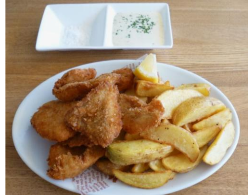
【真鯛のフィッシュ&チップス】