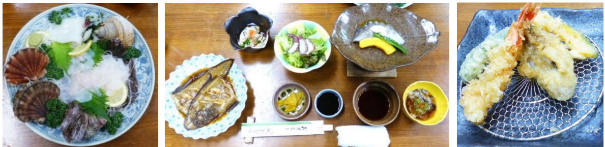
【みなと旅館の夕食】

その季節の料理が旅館の食卓に所狭しに並んでいる。ホタテ、イカ、鯛、牡蠣の刺身、ナマコの酢の物、イカのバター焼き、海老や牡蠣の天ぷら、どれも島で獲れたものばかりだ。カレイの煮付けは実に美味かった。