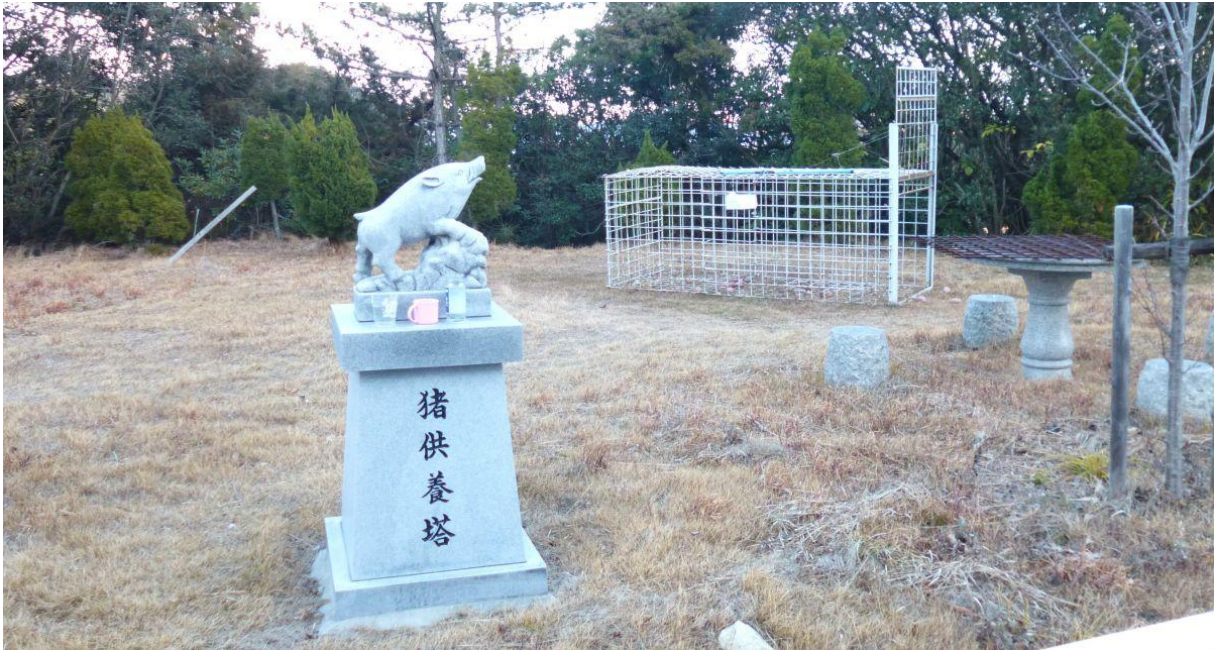
【猪供養塔と猪の罠の檻】

供養するくらいなら捕獲しなければと思うが、そうはいかないらしい。坊勢島は狭いから山と人里が近く、そのため猪による被害が多いのだろう。だから猪を捕まえて殺処分して、シシ鍋にでもして食べるのだろう。そのゆえ供養塔と罠の共演という珍しい光景が生まれた。