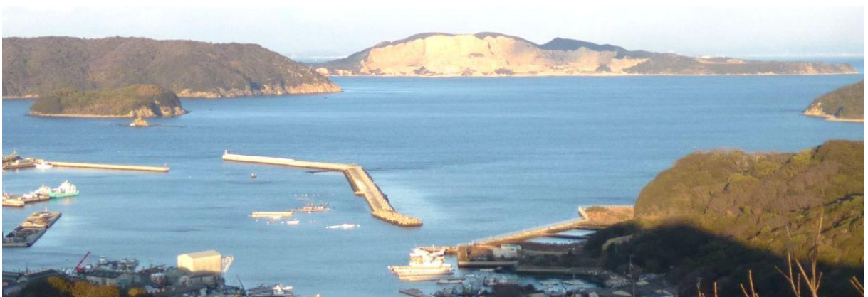
【中央奥に見えるのが男鹿島 手前は坊勢島の漁港のひとつ】

実に気持ち良い景色が広がっており、西に小豆島、南に四国と淡路島、東には男鹿島が見える。男鹿島は西島と同じように石が切り出され無残に山肌をさらしている。