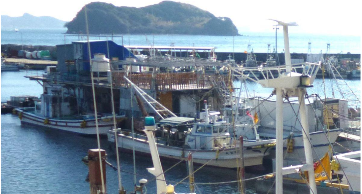
【海に浮いている掘っ立て小屋風レストラン】

残念ながら今は営業していないが、観光シーズンになれば店を開けてテラス席で魚貝類のBBQなどを食べることができるのだろう。