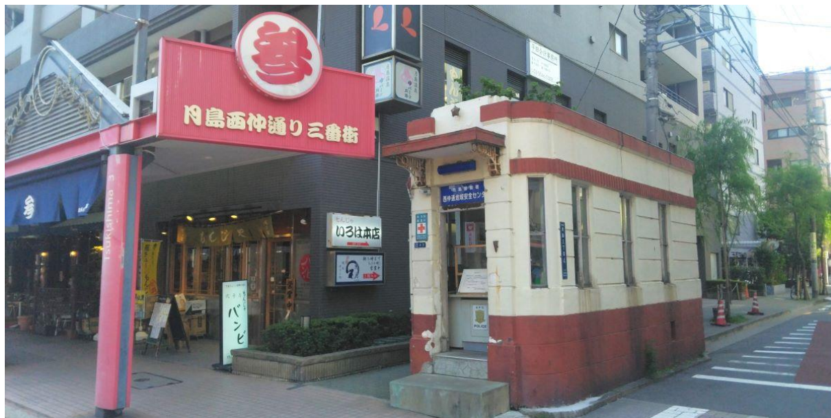
【月島もんじゅストリートにある現役の交番】

ここは交番、しかも現役の交番だ。再開発で取り壊されずに生き残った貴重な文化財だ。この街の不思議な一面を見ることが出来た。