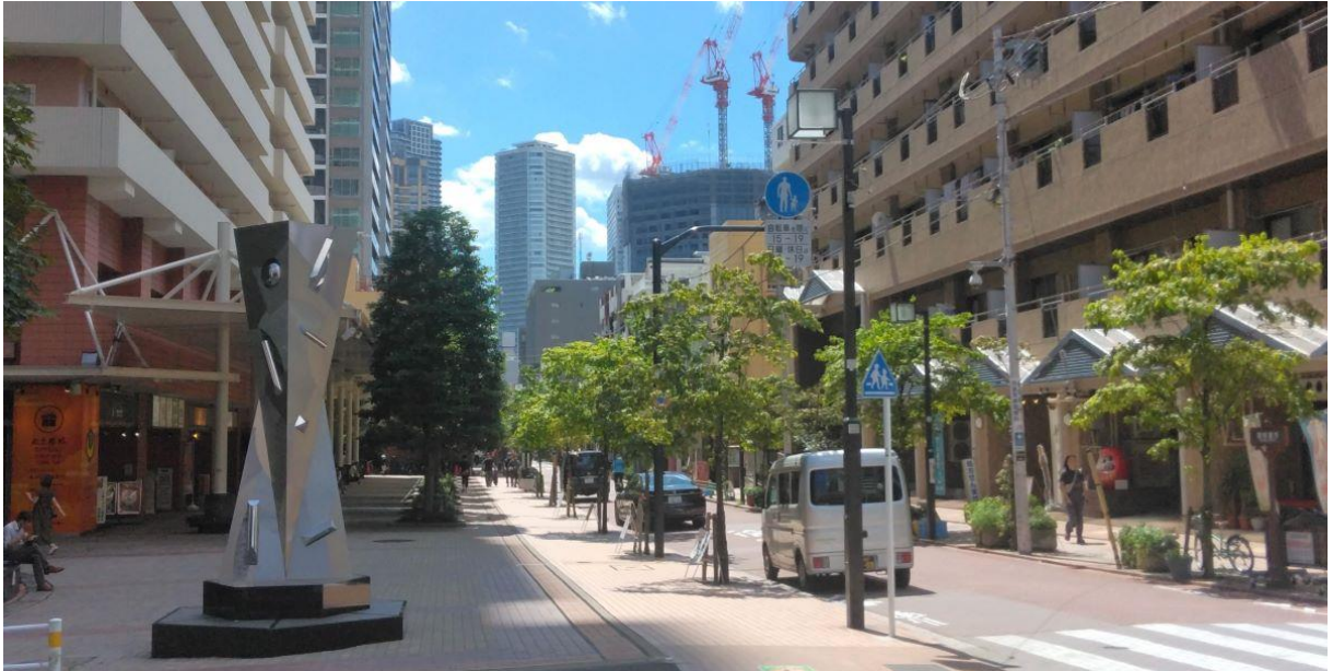
【月島もんじゅストリートの入口】

私は、レトロな雰囲気が漂う古くて庶民的な下町を想像していたが、全く異なる光景に驚いている。どうやら古い街並みは再開発されて、近代的な街並みに生まれ変わったようだ。