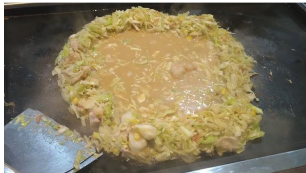
【キャベツで作った土手の中に生地を流し込む】