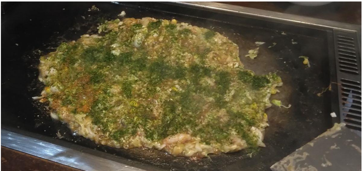
【追いソースと青海苔のトッピングしたもんじゃ焼き】

するとジモティが追いソースと青海苔をかけ始める。彼女曰く「ビールのつまみにはこのくらい濃くしないとね」と言っている。確かに追いソースと青海苔によってさらに旨くなっている。さすが地元、ただの呑兵衛ではない、地元の呑兵衛だ。