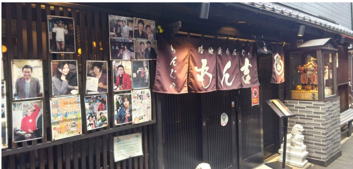
【もん吉の入口、暖簾】

表通りから少しだけ路地に入ると雰囲気の良い店がある。暖簾には「路地裏もんじゃもん吉」と書かれている。入口付近に有名人の写真やサインがたくさん飾ってあるので人気店だろうと思い、入店する。店内にも同じように写真がたくさん貼られている。