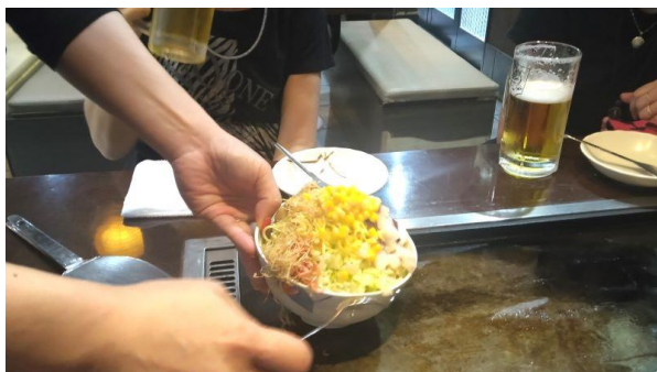
【店員が焼いてくれるもんじゃ焼き】

カチャカチャと鉄板を叩きながら焼いていく店員のヘラさばきのパフォーマンスがなかなか見応えがある。しかしよく見ていると、それは単なるパフォーマンスではなく、鉄板の上で土手になったキャベツと水分の多い生地を混ぜながらキャベツを細かく刻んでいる。このあたりの妙技が外国人に受けるのだろう。