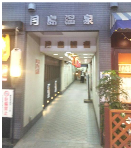
【月島温泉と月島観音の入口】

サウナもコインランドリーもあるから、風呂とサウナを楽しみながら洗濯が終わるという優れものの施設になっている。